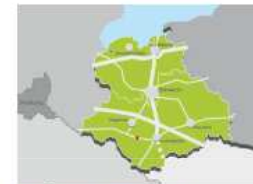
Abb. 1: Übersichtskarte Westmecklenburg

Im Rahmen der Aufstellung des Regionalen Raumentwicklungsprogramms Westmecklenburg 2011 (RREP WM) war das potenzielle Eignungsgebiet Windenergieanlage (WEG) Groß Krams Gegenstand von drei Beteiligungsstufen. Aufgrund antenschutzrechtlicher Bedenken hat die Verbandsversammlung auf ihrer 39. Sitzung am 05.05.2011 die Herausnahme des potenziellen WEG aus dem Entwurf des RREP WM beschlossen. Die Genehmigung des RREP WM wurde daraufhin ohne das stiftige Eignungsgebiet beantragt. Das Programm wurde am 31.08.2011 als Landesverordnung festgesetzt.