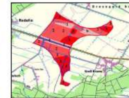
Abb. 2: Kartenauszug Gutachten

Allerdings könnte es ggf. aufgrund antenschutzrechtlicher Bedenke zu einer Flächenreduzierung im Zuge der Genehmigungsplanung kommen, in deren Rahmen eine strengere antenschutzrechtliche Prüfung stattfindet. Auch werden auf Ebene der Genehmigungsplanung weitere bzw. mehrere Arten betrachtet, die im Rahmen der Aufstellung des RREP nicht zu prüfen sind. Die Hindernisse sind dabei jedoch z.T. durch Ausgleichsmaßnahmen kompensierbar. Diese sollten in der Regel schon vor Baubeginn der Windenergieanlagen umgesetzt werden und im Nebbereich des Eingriffs erfolgen. Daher wird gutschichtlich empfohlen, auf regionalplanerischer Ebene nur diejenigen Flächen rechtsverbindlich auszuweisen, die im Rahmen der anschließenden Genehmigungsplanung als realisierbar eingestuft werden. Hierbei handelt es sich um die mit den Stufen 0, 1 und 2 bewerteten Planflächen entsprechend dem Abschlussbericht des o. g. Gutachtens.